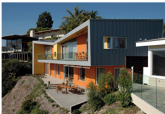
Version moderne d'un enduit à la chaux | www.naturawalls.com

Les enduits à la chaux permettent de récupérer les irrégularités du mur. Ils sont respirants et étanches à l'eau de pluie. L'enduit de chaux seul n'a par contre pas de propriétés d'isolation thermique intéressantes. Au niveau environnemental, un enduit de chaux implique deux fois moins d'énergie grise qu'un enduit au ciment et sept fois moins qu'un enduit synthétique.