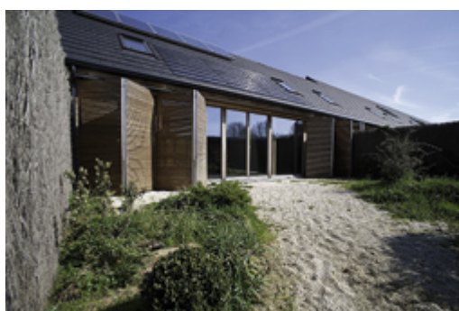
Revêtement de façade en bois

Le bois offre aujourd'hui une diversité étonnante de solutions, allant des traditionnels bardeaux de cèdre aux panneaux de bois, en passant par toutes les formes de bardage. Le bois permet ainsi de donner une allure traditionnelle, comme moderne au bâti. En rénovation, on profitera idéalement de la pose d'un bardage en bois pour réaliser une isolation par l'extérieur. L'isolant peut être fixé mécaniquement au mur existant. Puis un pare-pluie est installé. Un double lattage sur lequel on fixe le bardage permet ensuite de laisser une lame d'air entre le pare-pluie et le bardage. La lame d'air favorise le bon séchage du bardage et donc la conservation du bois.