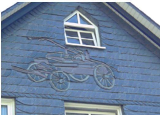
Façade en ardoises naturelles Stefan Didam

Les ardoises naturelles bénéficient d'une durée de vie très longue, mais sont chères à l'achat. Elles sont assemblées avec une superposition en « écailles de poisson », garantissant une étanchéité totale à la pluie et au vent. Les ardoises en fibrociment sont couramment utilisées comme alternative pour les ardoises naturelles. Beaucoup plus abordables, elles permettent également une grande variété de formes, dimensions et couleurs. Leur durée de vie est par contre beaucoup plus réduite (20 ans contre 100 ans pour les ardoises naturelles) et les possibilités de recyclage limitées à cause de la présence de résines et de fibres de synthèse.