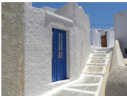
Version traditionnelle d'un enduit à la chaux

Il est possible de poser sur les façades des enduits de finition. Les enduits colorés à la chaux sont connus depuis longtemps. Utilisés traditionnellement pour protéger des constructions en pierre friable, ils se déclinent dans une grande diversité de teintes comme en témoignent les façades colorées de villages entiers en Italie.