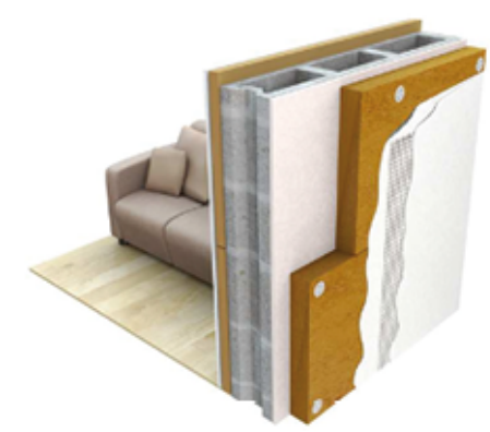
Application d'un enduit sur un panneau isolant