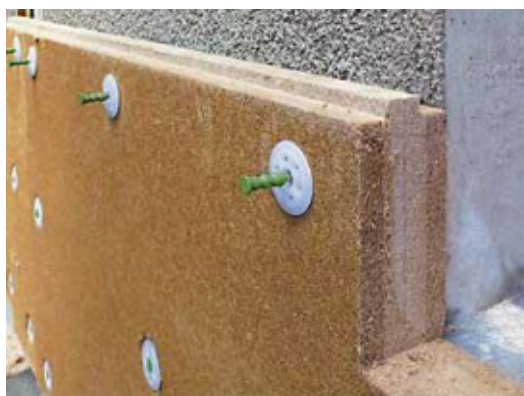
Panneau isolant en fibre de bois prêt à enduire

Les enduits à la chaux permettent de récupérer les irrégularités du mur. Ils sont respirants et étanches à l'eau de pluie. L'enduit de chaux seul n'a par contre pas de propriétés d'isolation thermique intéressantes. Au niveau environnemental, un enduit de chaux implique deux fois moins d'énergie grise qu'un enduit au ciment et sept fois moins qu'un enduit synthétique.