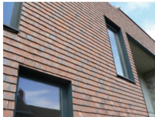
Façade de tuiles en terre cuite