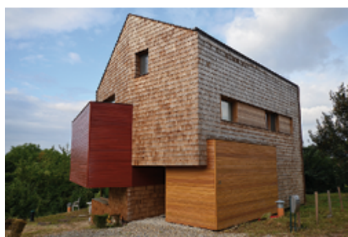
Façade en bardeaux de bois © Atelier Chora & WattsUp Engineering