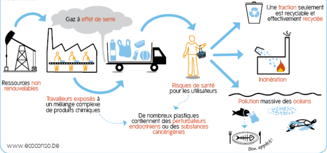
Illustration: écoconso. Sous licence creative commons CC-BY-NC-ND.

En résumé : impacts sur l'environnement et risques pour la santé des travailleurs et des utilisateurs.