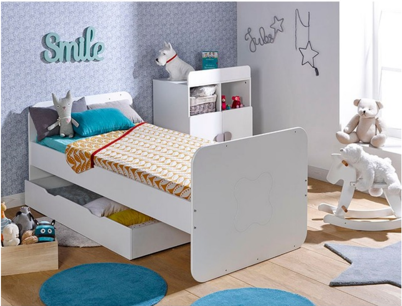
Exemple de lit évolutif