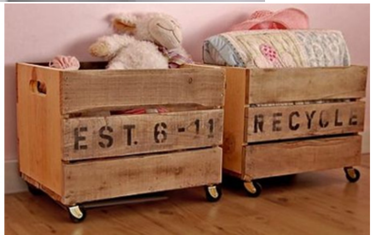
Étagère murale en tiroirs , mobiles et caisse à jouet de récup.