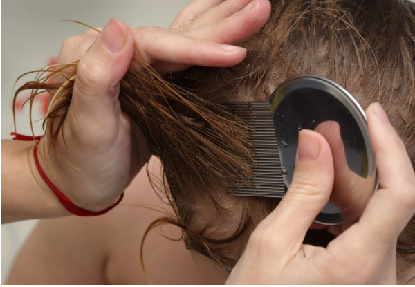
Chasse aux poux avec peigne