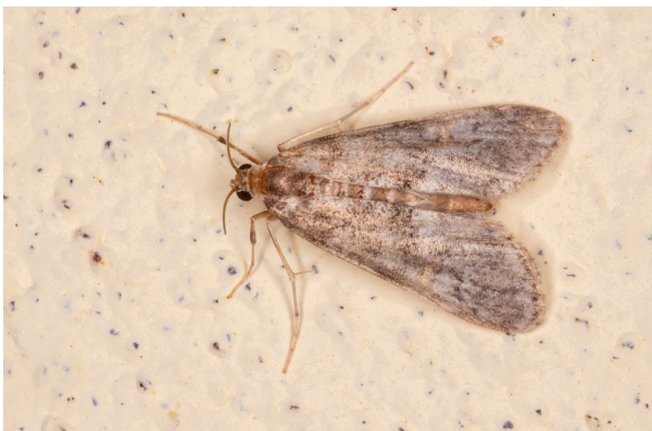
Mite de vêtements

> Lire : Mites de vêtements : astuces pour les éviter et s'en débarrasser