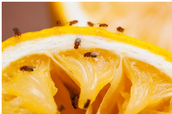
Mouches et mouchettes