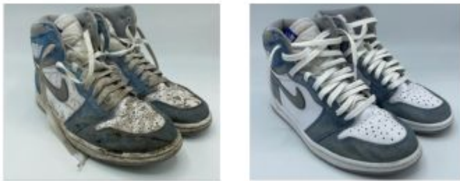
Illustration de l'effet d'un grand nettoyage de chaussure par Shoes on top