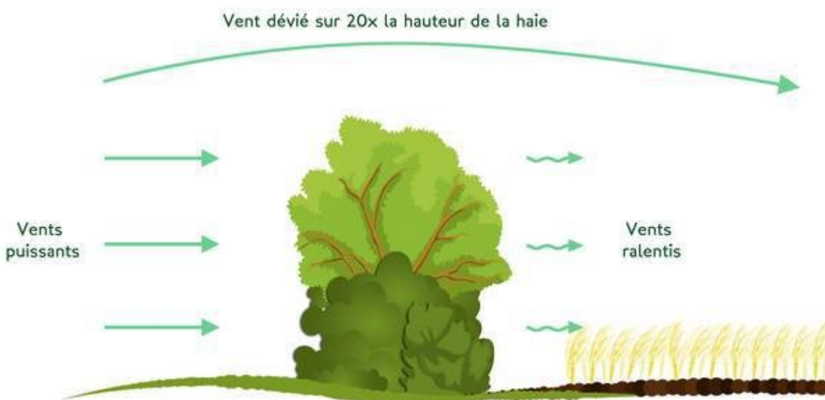
Illustration par A.Borget sur Terre en vie .