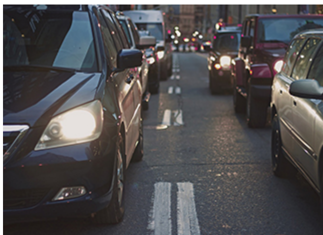
Moins et mieux utiliser sa voiture

Si chaque voiture belge diminuait sa consommation moyenne d'un litre, 13 500 tonnes de CO 2 seraient évitées tous les 100 km. Même en circulant en voiture, il est possible de faire des choix plus respectueux de l'environnement.