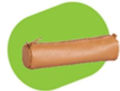
cuir ou tissu