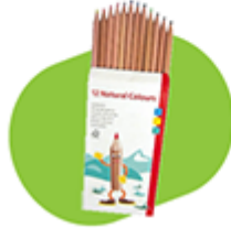
bois non vernis de préférence labellisé