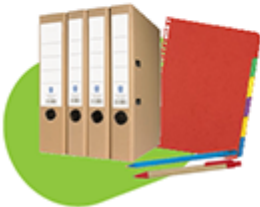
carton de préférence recyclé et /ou labellisé