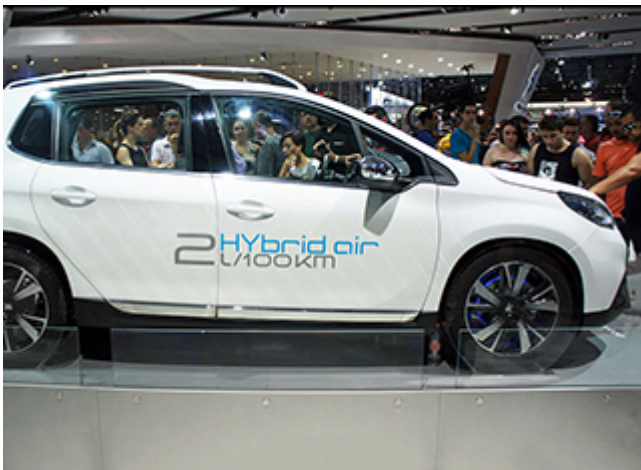
SUV hybride rechargeable (plugin) : écologique ou greenwashing ?

Une voiture hybride rechargeable qui combine les atouts de l'électrique en ville, l'autonomie sur route et affiche moins de 2 litres/100 km, ça semble magique ! Mais avec un poids dépassant les 2 tonnes pour certaines, peut-on vraiment parler de véhicule écologique ?