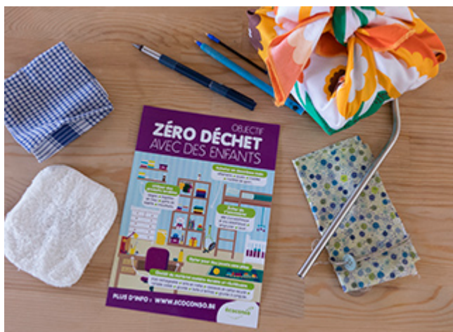
Objectif zéro déchet avec des enfants

On peut alléger sa poubelle même avec des enfants. Voici des conseils, astuces et idées pratiques pour une vie de famille zéro déchet.