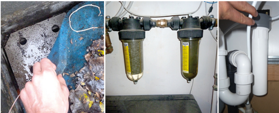
Les filtres pour l'eau de pluie.

Attention, on veille à nettoyer ou remplacer régulièrement les filtres !