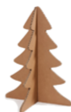
Sapin fait maison en carton ou palettes de récup' 0 €