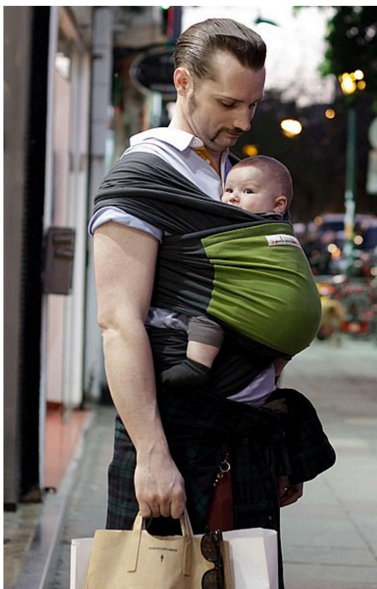
Exemple d'écharpe de portage

> Voir aussi : quel matériel choisir pour bouger avec bébé ?