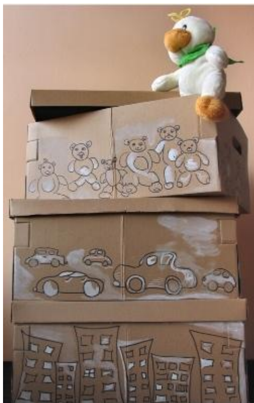
Étagère murale en tiroirs, mobiles, caisse à jouet de récup et en carton.