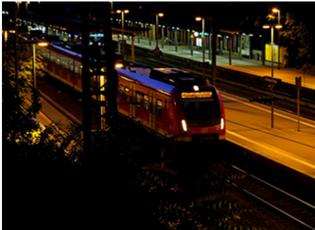
Le retour des trains de nuit en Belgique

Après Vienne, on peut aussi se rendre à Berlin en train de nuit depuis la Belgique. D'autres destinations sont à l'étude.