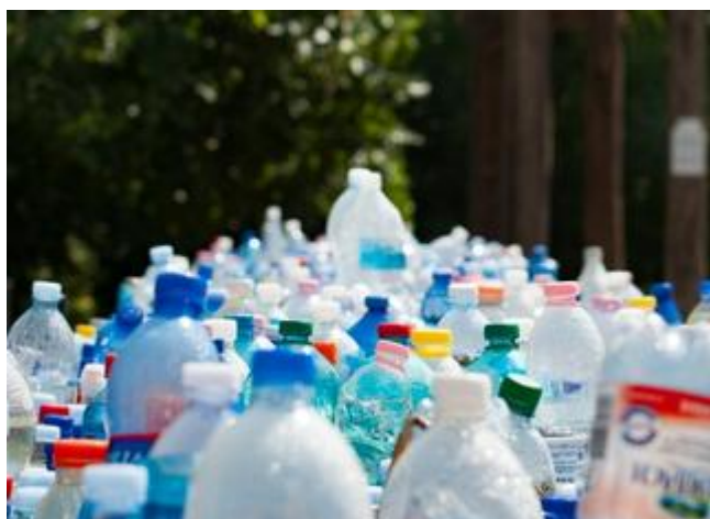
Le recyclage a ses limites

Souvent vu comme LA solution pour les déchets, le recyclage a ses limites. Peut-on tout recycler ? Combien de fois ? Avec quel impact ? On fait le point.