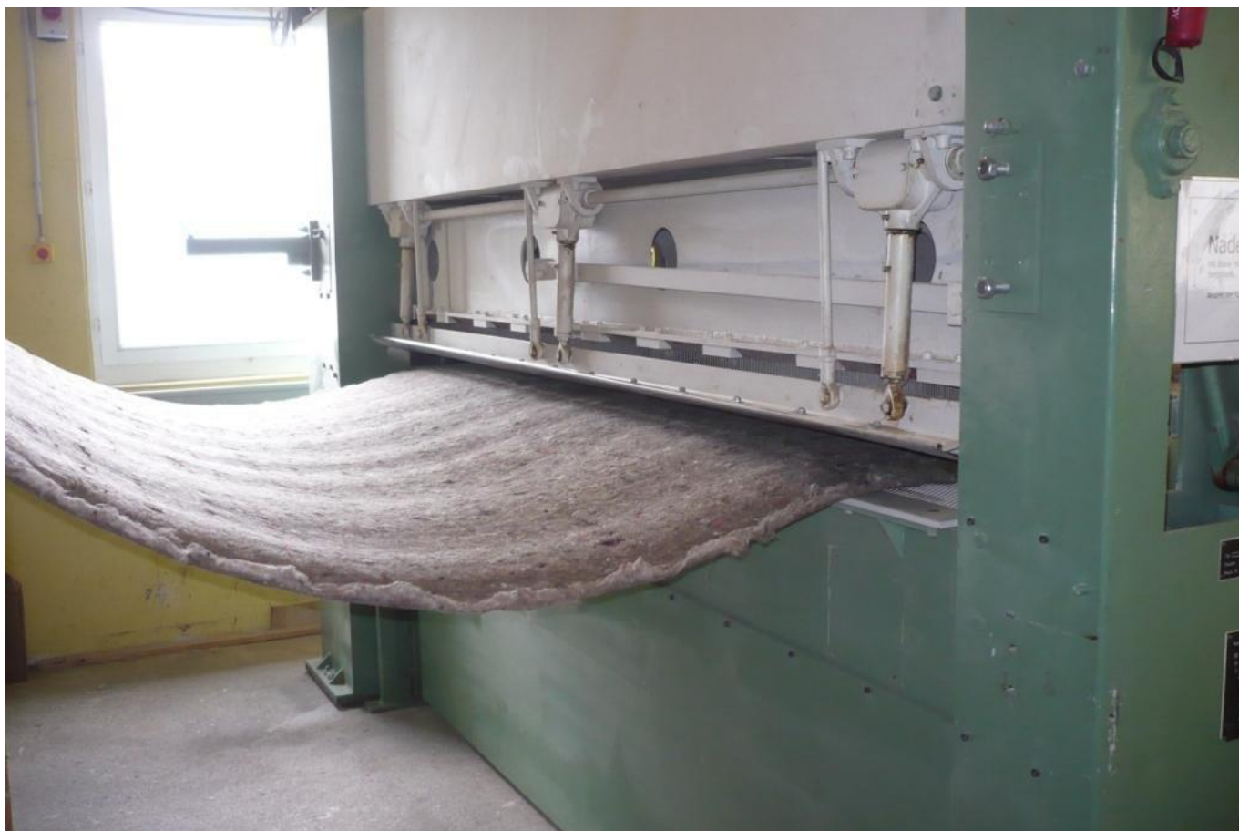
Aiguilletage d'un isolant