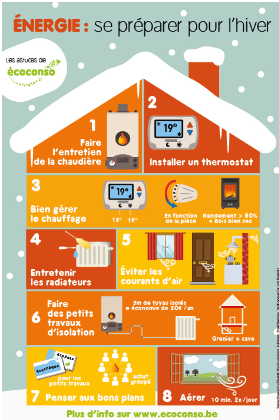
Économiser le chauffage : 8 conseils pour préparer l'hiver - Infographie : écoconso [CC-BY-NC-ND] (cliquer pour agrandir)