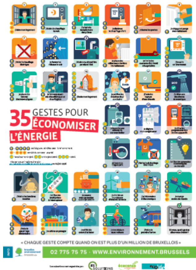
Poster 35 gestes en PDF [2] (6 Mo)

A la fin de l'animation les participants reçoivent un accroche-vanne qui leur rappelle la correspondance entre les numéros indiqués sur les vannes thermostatiques et les températures obtenues dans la pièce.