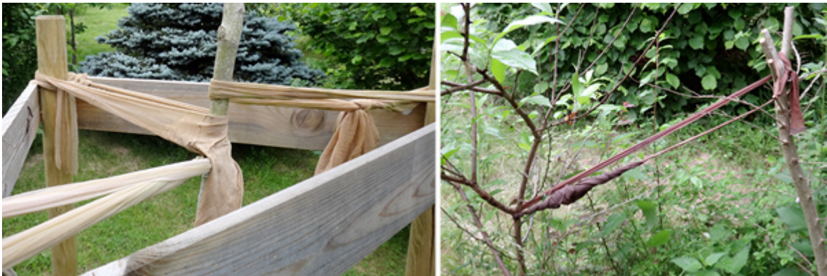
On peut utiliser ses collants filés pour attacher de jeunes arbres à un tuteur

En attendant le retour des collants qui durent une vie, on peut essayer de faire bouger les choses. On peut signer l'appel de l'asbl HOP pour des collants durables [7].