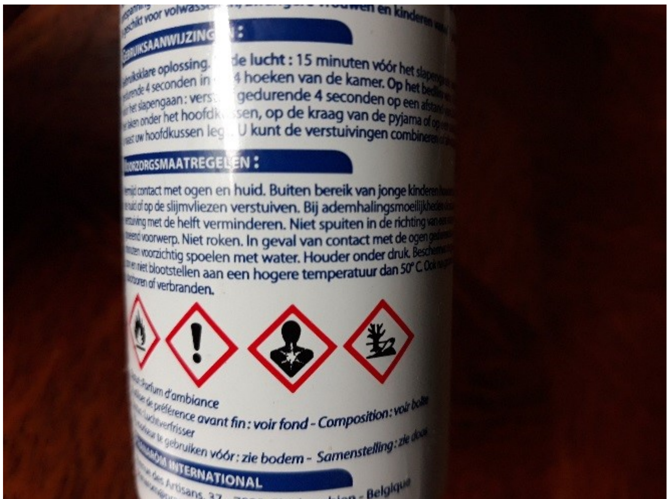
Pictogrammes de danger sur l'étiquette d'un parfum d'ambiance aux huiles essentielles.