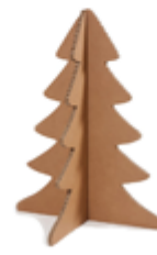
Sapin fait maison en carton ou palettes de récup' 0 €