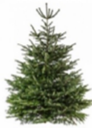
Sapin bio belge, coupé soi-même 30 €