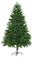
Sapin artificiel 137 €