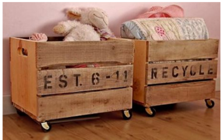
Étagère murale en tiroirs , mobiles et caisse à jouet de récup.