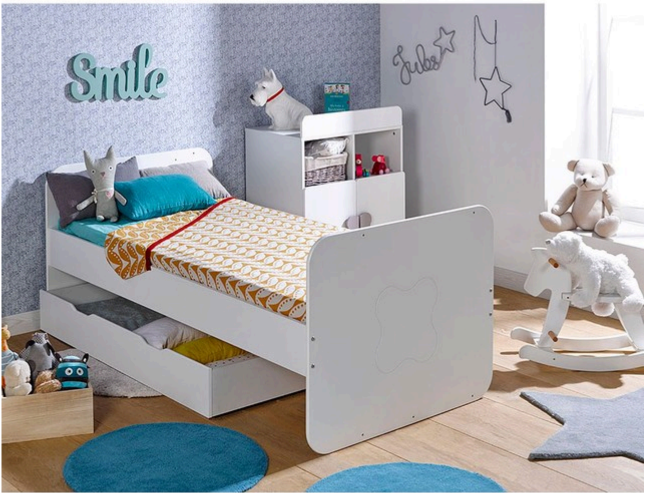
Exemple de lit évolutif